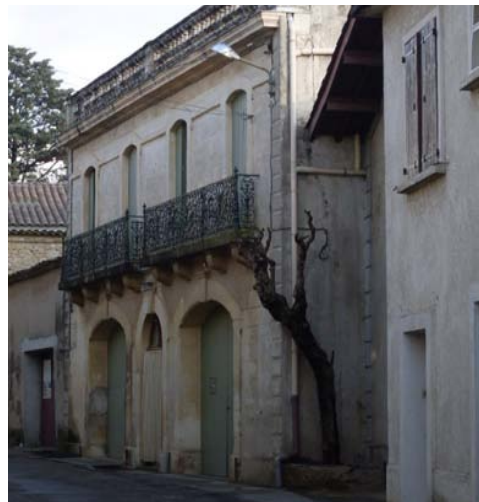
JEP 2014 : Vendémian : du donjon au clocher. La frabrique médiévale d'un village languedocien.

On peut considérer que vers 1900, l'ancien village médiéval est désormais enveloppé de tous côtés par de nouvelles constructions. L'ancien quadrilatère laisse place à une nouvelle agglomération qui se développe en étoile. Les nouveaux quartiers s'étirent maintenant le long des voies qui s'enfoncent vers le vignoble. Vendémian connaît sa troisième mue