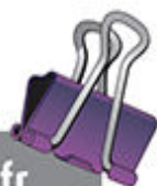
Photo : Antenne Toiture/Ile-de-France